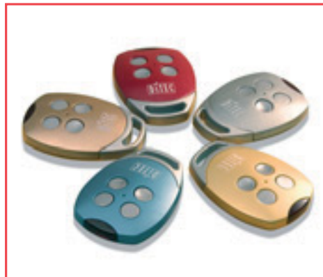
GOL4V - GOL4CV