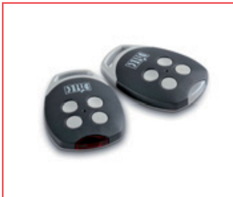
GOL4 - GOL4C